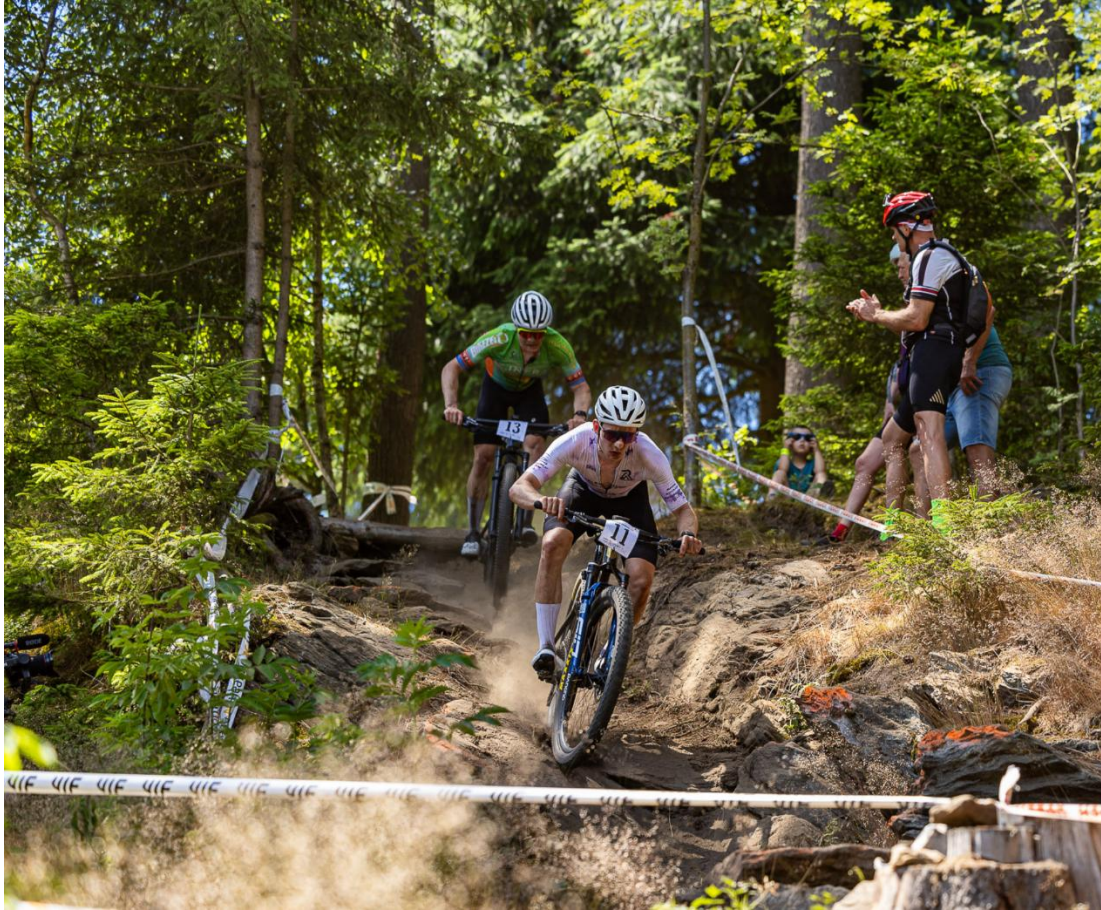
Skluzavka / Waterslide