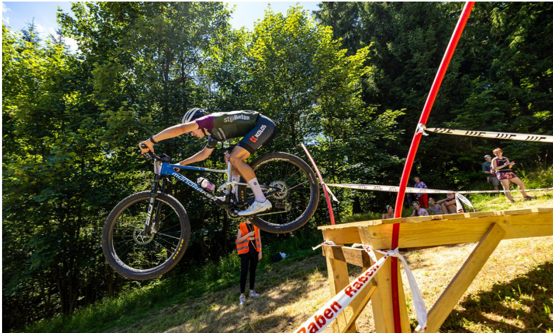
Big Air 10 / Big Air 10