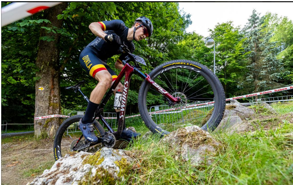
Bismarkův schod / Bismarcks step

A selection of the most interesting sections on the track: