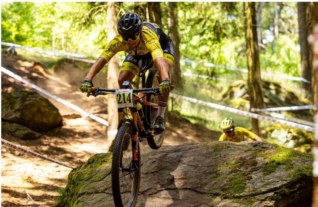
Skalka odvážných / Rock of fearless