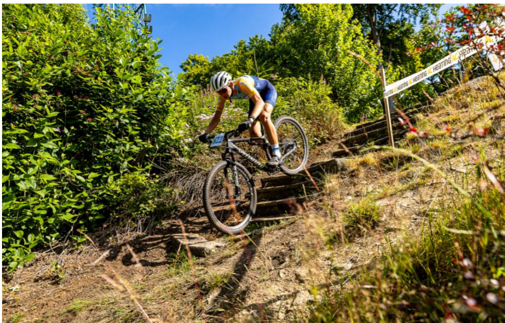
Deskalátor / Descalator