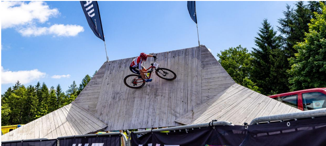
Stěna smrti / Wall of death